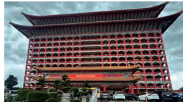
地区大会会場・圓山大飯店