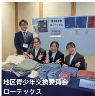
地区青少年交換委員会 ローテックス