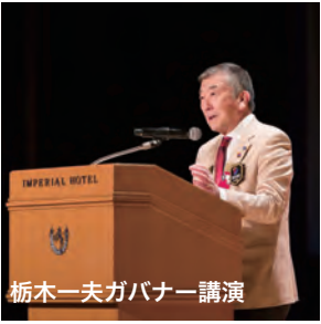
栃木一夫ガバナー講演