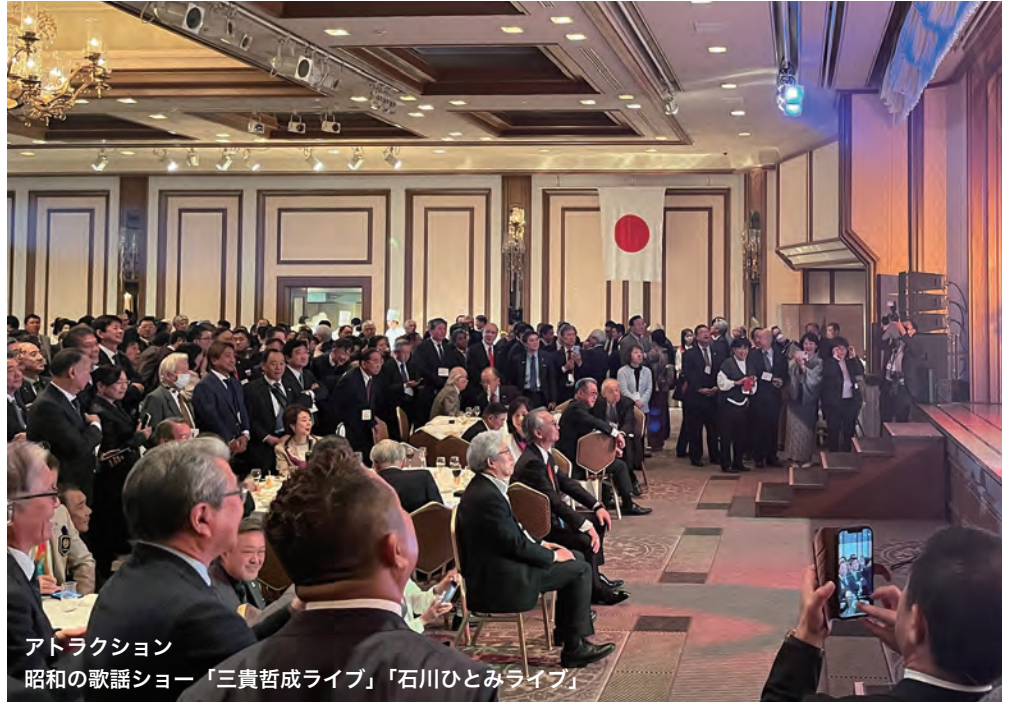
アトラクション 昭和の歌謡ショー「三貴哲成ライブ」「石川ひとみライブ」