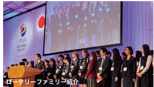
ロータリーファミリー紹介