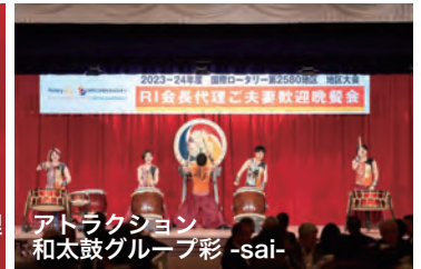
アトラクション 和太鼓グループ彩 -sai-