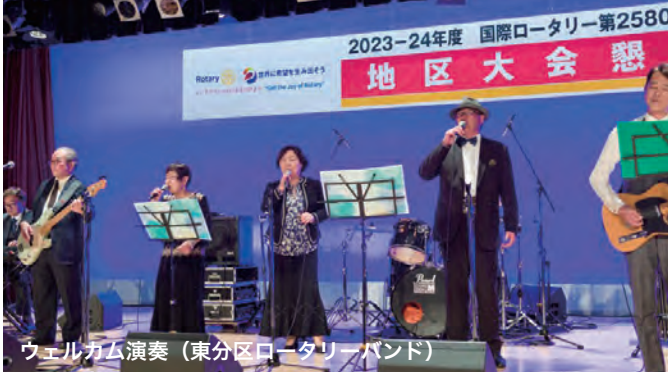
ウェルカム演奏 (東分區ロータリーバンド)