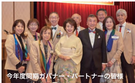
今年度同期ガバナー・パートナーの皆様