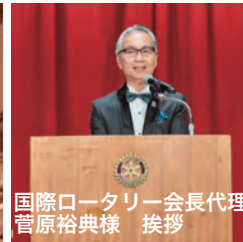
国際ロータリー会長代理 菅原裕典様 挨拶