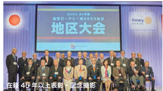
在籍45年以上表彰・記念撮影