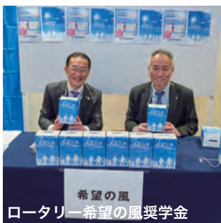
希望の風 ロータリー希望の風奨学金