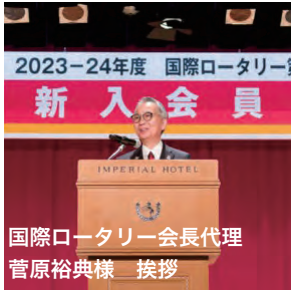
2023-24年度 国際ロータリー 新入会員 国際ロータリー会長代理 菅原裕典様 挨拶