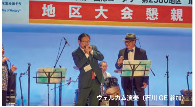
ウェルカム演奏 (石川 GE 参加)