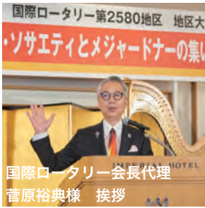
国際ロータリー会長代理 菅原裕典様 挨拶